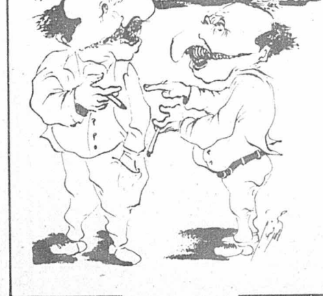
بزرگسالان اول: راستی این عمو چرا با کمک ما نمی آید؟ بزرگسال دوم: بپایه از وقتی شاهمان (!) رفت، شش دغه آمده، اما گمون نمی کنم هر قدر سازمندانارن کوشش کنیم، این دغه هم موفق بشه!

اهالی از نحوه توزیع و نرسیدن مواد غذایی شکایت دارند. آب آشامیدنی بهداشتی مشکل دیگر اهالی منطقه است. در برخی از نقاط روستاها مدت یک شاعر روز در نوبت آب می آیدند، تا بتوانند از چشمه ای ۱۵۰ کیلومتری، که باز در آب بسیار کمی دارد، آب را بدهد خود بسیار دور. در حدود ۳ سال پیش در مصلی در مانگاهی ساخته شده، که به بلا استفاده مانده است. اهالی میگویند: "حداقل میتوان یک بهار در آن سکونت داد، تا ما مجبور نشویم برای یک شکم درد و یا زخم جزئی مبلغ ۴۵۰ ریال