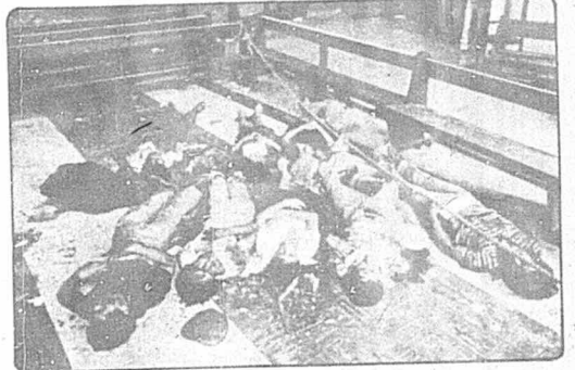
«حقوق بشر» آمریکایی در السالوادور

«رهبری انقلابی متحد» (دیرکسیون رولوسویاریا و شفاکادا «د.ر.و.») در روند اتحاد عمل فرایند محنتناز انقلابی خلق السالوادور در اواخر بهار ۱۳۵۹ پایه گذاری شد. این نهاد مبارزه عمو تشکیل می گردید که به نسبت برابر، مساویتی بیخ سازمان عمو «حیبه آزادی ملی»