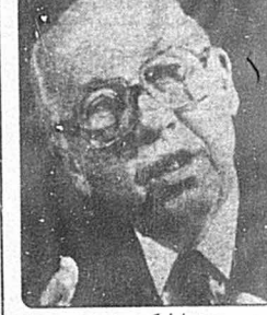
ویلیام کیمی: مدیر «سیا»

هم از طریق «اصل درگردان» هم بیرونی قدرت اقتصادی و حاکمیت دولتی تحق می یابد.