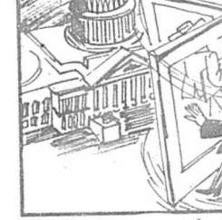
اصل در گردان

دولت رونالد ریگان سه، مانند دیگر دولت های آمریکا، از نمایندگان