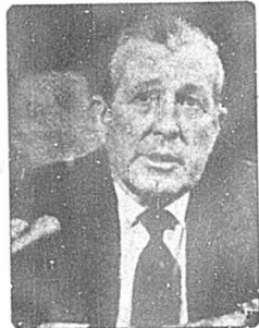
دونالد ریگان: وزیر درازی

الکساندر هیک (وزیر خارجه) وی در دوران ریاست جمهوری نیکسون (۱۹۶۹-۱۹۷۴) و فورد (۱۹۷۴-۱۹۷۷) در دستگاه دولت فعالیت داشت. الکساندر هیک پیش از احرار مقام وزارت، یکی از روسای کنسرو «پولیند تکنولوژی» بود، که یکی از بزرگترین کسین های سیست گانه ایالات متحده آمریکا بشمار می رود. هیک در سال های ۷۹-۱۹۷۴ فرمانده عالی نیروهای «ناو» در اروپا و فرمانده کل نیروهای مسلح ایالات متحده آمریکا در اروپا بود. کاسپار واین برگر (وزیر دفاع): واین برگر در دوران ریاست جمهوری نیکسون، مدیر بوجه و سپس وزیر سپهاری، آموزش و پرورش و امور اجتماعی بود. وی پیش از آن که در کابینه ریگان وزیر شود، معاونت مدیر «جنگل پاکور کابووروش» (سان-فرانسسکو) را عهده داشت.