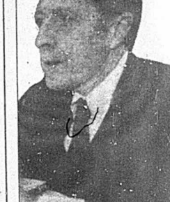
کاسپار واین برگر: وزیر دفاع

کوتنه هم بیرونی قدرت اقتصادی و حاکمیت دولتی را در چارچوب سرمایه داری انحصاری دولتی ایالات متحده آمریکا به ثبوت می رساند.