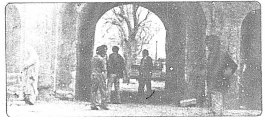
در ورودی قلعه

عدم اجرای کامل قانون اصلاحات و اعلام تعویق بند "ج" و بند "د" این قانون، اینک که ششماه از اعلام عمومی موفقی گذشته و کشت بهار مقرر شده، نمی‌تواند مورد قبول دهقانان زمینکش و نهادهای انقلابی باشد. آنها همراه می‌طلبند که برای قطع آبادی مالکان بزرگ و مستکرمی و غارتگری آسان، سبب اصلاحات ارضی بصورت کامل و هر چه زودتر، و بویژه بندهای "ج" و "د" آن، به اجرا گذاشته شود.