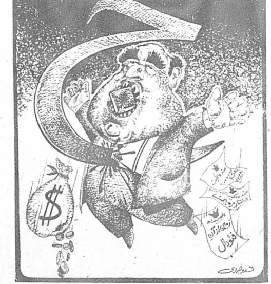
نقل از کیمپان - سوم اسفند ۱۳۵۹

لنجان مانند: فلک‌آباد، میرآباد، حسن‌آباد، سکوآباد (زرخه) درجه‌عابد و دیگر مناطق اطراف اصفهان شد. پس از مرگ بزرگ مالک اول، زمین‌ها بین پسرانش تقسیم شد. یکی از دهقانان خیرآباد، درباره مالک فعلی، حاجی می‌گوید: