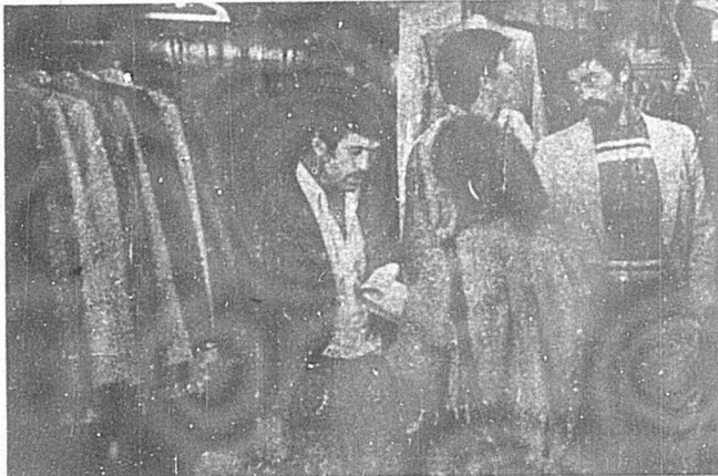
کارگر پاسدار، که عید ندارد، ولی از انقلاب پاسداری میکند

به مناسبت دومیین سالگرد پیروزی انقلاب، نمایشگاه عکسی از جنایات رژیم شاه ملعون و همچنین پوسته‌هایی از مبارزات قله‌های جهان علیه امپریالیسم آمریکائی، از سوی هواداران حزب توده ایران در محلات برپا شد. این نمایشگاه، که به مدت هروز به طول انجامید، مورد استقبال مردم قرار گرفت.