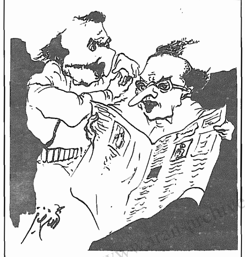
بزرگ مالک اول: توی روزنامه چی نوشته که اینقدر توهم رفتی؟ بزرگ مالک دوم: باز هم یک روحانی دیگه گفته طرح واگذاری زمین هم جنبه قانونی داره هم جنبه شرعی.

حجت الاسلام حسینی نماینده ما که کم شرع در هیئت و نماینده شورا های اسلامی گران ضرورت اجرای قانون اصلاحات ارضی و بی پایه بودن تبلیغات بزرگ مالکان و آیادی آنان را تأیید کردند.