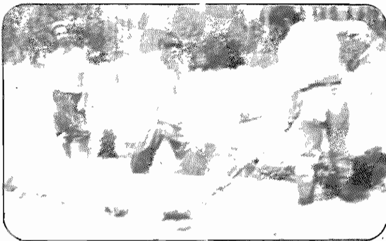
زین انعامین سجای عوص سجای، نریان اییم، مسول ساحس بدآب ده هستند. قربان می گوید: "گرفتن این عکسها چه تاثیری برایم دارد؟ شما که عکس ما را می گیرید، آنها را به مسئولان دولتی نشان دهید که ما این طوری زندگی و کار می کنیم. تافکری برایشان بکنند"

اس روسا با ۹۵ خاوراسکس خود، در ۱۴۱ کلومتری سهرسان بخورد و ۲۱ کلومتری مرکز بخش "راز" واقع است. مردان ده با زراعت و دامداری زندگی می - گذرانند و رنان ده سر به مالی نامی