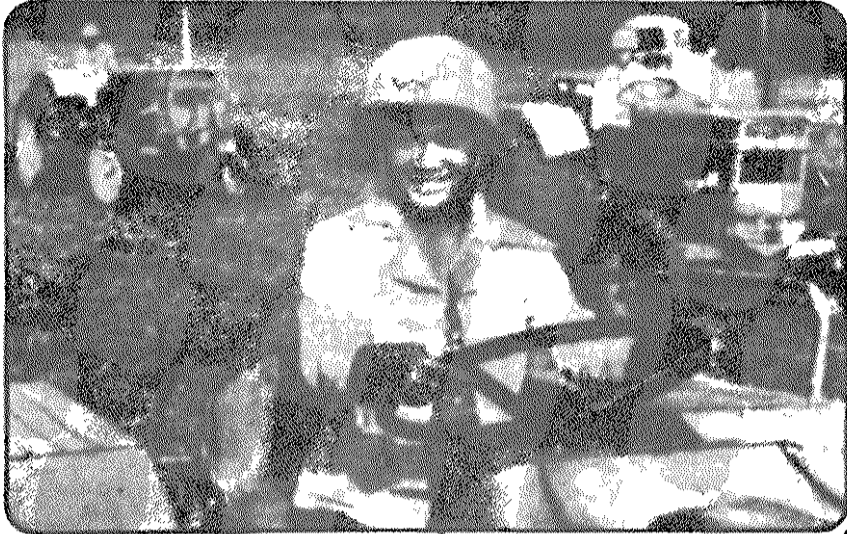
مقتانان زحمتکش لائوس سرزمین آرزو خود را آباد می‌کنند

شمالی را تدارک دید. اواسط سال ۱۳۵۱، هشتاد درصد سرزمین لائوس، که در حدود یک سوم جمعیت آن کشور در آن زندگی می‌کردند، تحت کنترل نیروهای مسلح آزادی بخش خلق بود.