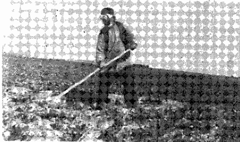
این پیرومرد از روستای ورزنه ۷۰ سال سن دارد و هنوز هم روی زمین ارباب کار میکند

ماز بنیادهای انقلابی، بخصوص از جهاد سازندگی و سپاه پاسداران انتظار داریم که این حرکت سازمانی را در جهت عظیم گذاردن کوشش ضد انقلاب بهمه انتقال کشور سرایت دهند. کلیه هواداران بافانلانه پشتیبان این فعالیت و نجات خرمنها از دستبرد عناصر ضد انقلاب بوده و هستند.