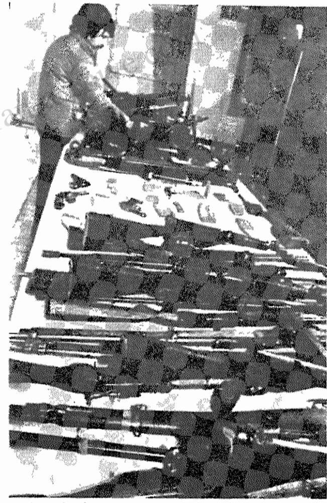
اسلحه آمریکایی و چینی که برای ضدانقلابیون فرستاده میشود

تورپس یادآور میشود که: «یکانه انگیزه اینگونه اعمال بنظر من فقط می‌تواند ابتداء به حرفه رازخانی و غارت باشد. شورشیان رازخان فقط در یک مسئله کامیابی کامل دارند و آن برانگیختن خشم و نفرت اهالی محل است.»