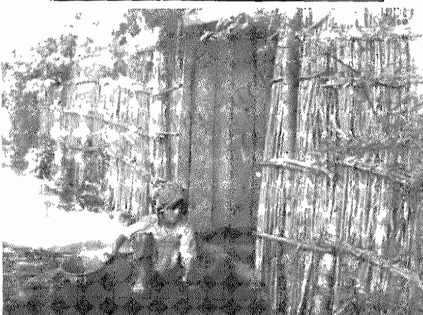
دختر روستایی در کنار خانه اش ظرفها را میشوید. از بهداشت خوبی نیست (روستای سده - کیلان)

درآمد کشاورزی ما و محصول ما از بین رفته و نمیتوانیم بهاره بکاریم و ما صاحبان زمینهای مذکور الان بیکار هستیم و نمیتوانیم خرج خانواده خود را بپردازیم. لذا از اداره محترم خواستاریم که کمکی بجا کشاورزان بکنید و ما را یاری کنید ما چندین بار شکایت کردیم و آن کسی که شکایت ما توجیهی نکرد. ما خواستار یک کارشناس هستیم.