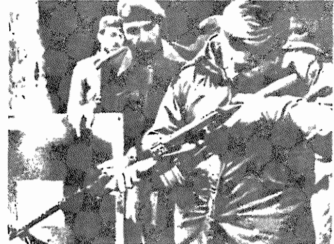
برزیسکی، مشاور امنیت ملی رئیس جمهوری آمریکا، هنگام بازدید از سرز پاکستان و افغانستان، یک اسلحه چینی را آزمایش می‌کند

«پراودا» ۷ ژانویه ۱۹۸۰ نوشت: «در اردوگاههای ویژه که در خاک پاکستان، در استان شمال باختری، بلوچستان و سایر نواحی نزدیک به سرز افغانستان تشکیل شده‌اند، به شورشیان آموزشهای لازم داده میشود. مربیان آمریکایی و چینی