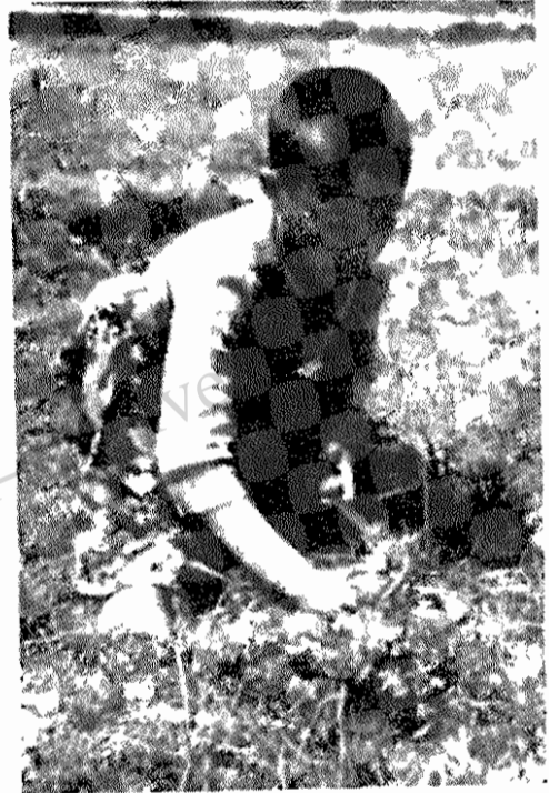
کلاس سوم دبستان هفتم، روزی چند ساعت درس میخوانم و بقیه اش را روی زمین کار میکنم (روستای حبیب آباد - اسفهان)