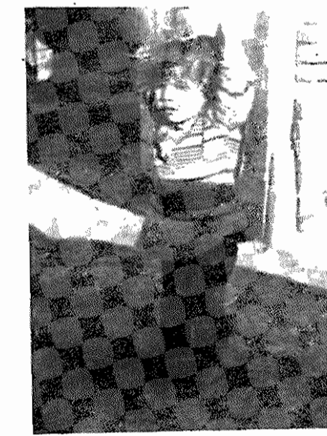
این کودک بزودی احتیاج به مدرسه خواهد داشت (روستای الواسفل - تبریز)

رقم بیسوادان بین کودکان ۱۰ تا ۱۴ ساله قرار گرفته است (حدود یک میلیون نفر) حال آنکه تعداد بیسوادان گروه ۶ ساله و ۹ تا ۱۳ ساله با ۹۳۶۷۵ تقریباً در همان سطح گروه ۱۴ تا ۱۸ ساله قرار دارد. از این مقایسه میتوان نتیجه گرفت که تعداد بیسوادان به نسبت سن بالاتر می رود. تعداد ۴۶۰ نفر از دختران و ۲۴۰ نفر از پسران بطور ناخوشایند آموخته اند این تعداد فقط میتوانند بخوانند، ولی قادر به نوشتن نیستند. شرایط نابسامان کار و زندگی زحمتگزاران، که با شدیدترین نوع استثمار همراه است، بعد از انقلاب شکوهمند ایران دهقانان را وادار به مبارزه ای جلدی برای طرد شیوه های استثمار و فئودالی در روستاها کرد. آنها خواستار بهبود وضع زندگی، آموزش و بهداشت و فرهنگ هستند، که بدنیال حل مسئله زمین و نحوه مالکیت بر آن بعنوان امری عاجل دستور روز جنبش های دهقانی بعد از انقلاب قرار گرفته است.