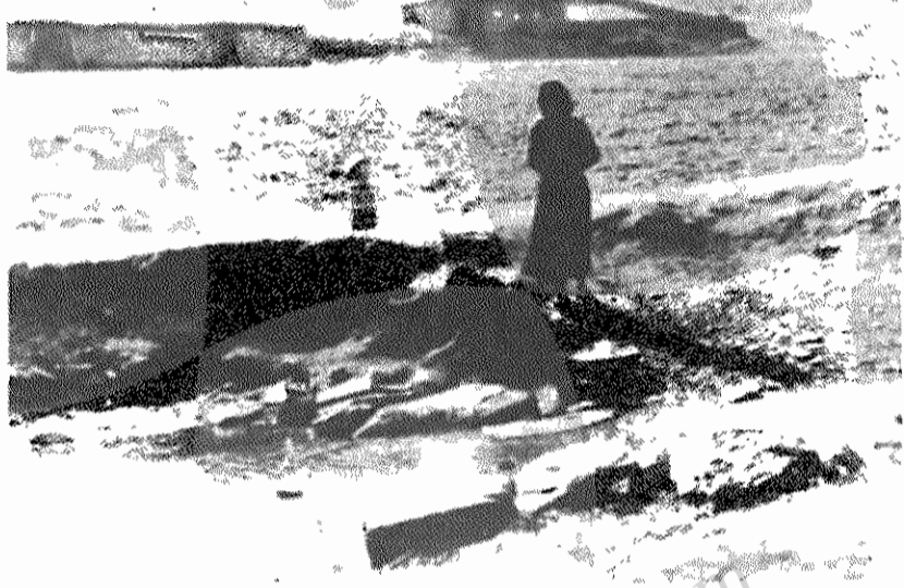
ده سیاه قل ( نزدیک مهاباد) - تنها محل تأمین آب مشروب اهالی، که در موقع طغیان رودخانه بزرگ آب می رود و غیر قابل استفاده میشود

آماده باشید! بمسئولان دولتی و نهاد های انقلابی برای اجرای هر چه سریعتر و بهتر و قاطعتر اصلاحات ارضی کمک کنید.