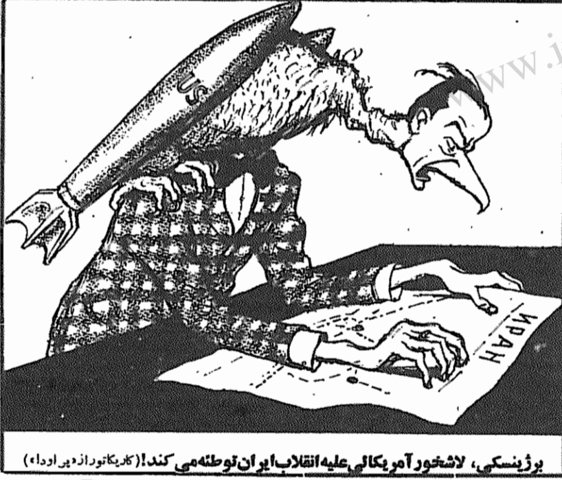
بورژوازی، لاشخور آمریکایی علیه انقلاب ایران توطئه می کند! (کلید تورا زدی اودا)

شاه محمد دوست گفت که پیشنهاد تشکیل کنفرانس بین المللی تحت نظارت سازمان ملل یا تحت نظارت سازمان دیگری برای با صلح بررسی اوضاع قاطعانه رد میشود، زیرا این پیشنهاد تلاش دیگری برای مداخله گستاخانه در امور مردم افغانستان است.