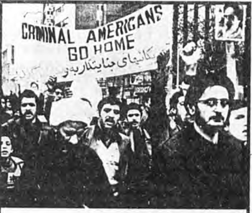
کارگر و روحانی بر ضد امپریالیسم آمریکا

در توان عظیمی که انقلاب ایران را جامعه ما ایجاد کرد، طبقه کارگر، فرمان می‌دهد، آن موج انبساطی شدت‌گویی را تشکیل داد که در آخرین تحویل و در آن‌جا که مسئله مرگ یا زندگی حشر - مسئله شکست یا پیروزی انقلاب مطرح شد، سرپوش ساز گردید. یک نگاه واقع نشان می‌دهد که کارگران ایران چه نقش قاطعی را در تکمیل انقلاب، در سست‌گیری خلقی آن، در تعیین ماهیت دگرگونی و ضد امپریالیستی آن و بالآخره، در به‌پیروزی رساندن آن ایفا کرده‌اند.