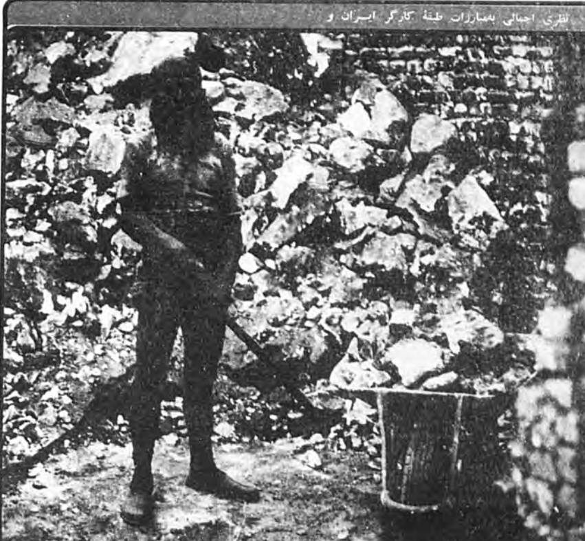
نظری اجتنابی به مبارزات طبقه کارگر ایران و برای به‌دست آوردن حقوق حقه خویش استفاده نمودند.

۲۳ خرداد ۱۳۳۸ هزارهفتصد نفر کارگران کارخانه وطن اسفهان اعتصاب کرده و خواهان اضافه مستخدم شدند. ولی آن‌ها هم مانند کارگران کوره‌پزخانه‌های تهران با نظری اجتنابی به مبارزات طبقه کارگر ایران و برای به‌دست آوردن حقوق حقه خویش استفاده نمودند. و به‌انواع و اشکال مختلف، از اعتصاب و تظاهرات گرفته تا بستن نشتن و تشکیل جلسات اعتراضیه و غیره متوسل شدند. پس از کودتای ۲۸ مرداد دشمنان طبقه کارگر ایران خیال می‌کردند که هرگونه عطف مبارزه‌جویانه در صفوف کارگران نمت نماید. در سال ۱۳۳۶ اعتصاب مراد ۱۳۳۶ کارگران آبادان، درست درسال‌های نخست‌مطره کسریوم بین‌المللی نفت، تمام محاسبات خوش‌بینانه استعمارگران را در هم فرو ریخت. گرچه مناطق نفت‌خیز همچنان در زیر چنگ نظامیان بود ولی کارگران نفت - سراسر کویت و فنار را در هم شکست و پرچم مبارزه را دوباره برافراشتند. اعتصاب مراد کارگران نفت آبادان با پیروزی پایان یافت و در تاسمان و پائیز سال ۱۳۳۶ کارگران نفت متحد سلیمان و آماجاری سلسله اعتصاب‌هایی را آغاز نمودند. کارگران خواهان اضافه مستخدم و به‌رسمیت شناختن حق اعتصاب بودند. بنا به درخواست رؤسای کسریوم نفت‌مقامات دولتی اعتصاب را غیرقانونی اعلام و سران اعتصاب را روانه زندان ساختند.