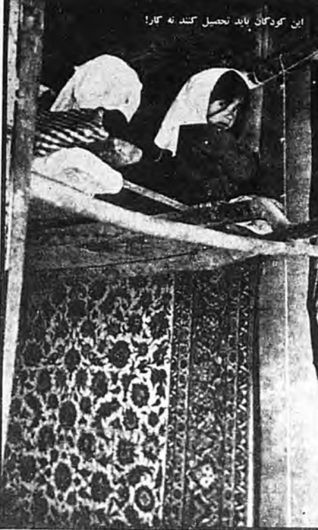
این کودکان باید تحصیل کنند نه کار!

اعتصاب کردند. در همان روزها ۸۵۰ نفر راننده شرکت‌های نفت میتینگ همبستگی کارگران اعتصابی تشکیل داده و ملی قلمنامه‌ای خواهان تعیین حداقل دستمزدها شدند. بار در همین ماه کارگران اخراجی از کارگاه‌های سنجی رشت در میدان شهر بست نشستند. چهارصد نفر از کارگران کارخانه «فارس» شیراز که تعطیل شده بود در مقابل عمارت استانداری به تظاهرات دست زدند و خواهان پرداخت حقوق موقه و مستمری برای دوران بیکاری شدند. در خردادماه خیر اعتصاب کارگران چهار کارخانه سنجی اسفهان که پرداخت حقوق موقه را طلب می‌کردند منتشر شد. یکی از آن‌ها کارخانه نور بود که از سال ۱۳۳۵ با سال ۱۳۴۰ کارگران آن ۵۲ بار اعتصاب نموده بودند. در شهریورماه ۱۳۴۰ آتش‌نشان‌ها و رفتران لنگرود دست به اعتصاب زدند. سپس کارگران منجیل اعتصاب کردند. ۲۸ آبان ۱۳۴۰ عده‌ای از نمایندگان کارگران که در میان آن‌ها راننده، بافنده، ریسنده، سیانکار، بنا، نجار، ولی این اقدامات نتوانست روح مبارزه کارگران را در هم