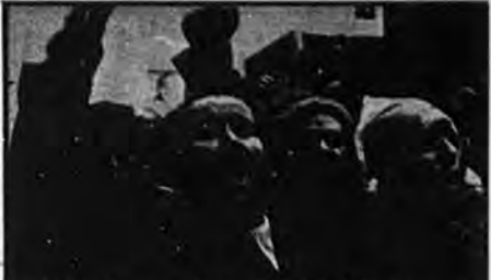
مردم زحمتکش ایران تا همین منتهای گمراهی، رژیم تا دندان بخوری را از پای نیاوردند. (نظرات روزهای غمناک و ناخوش)