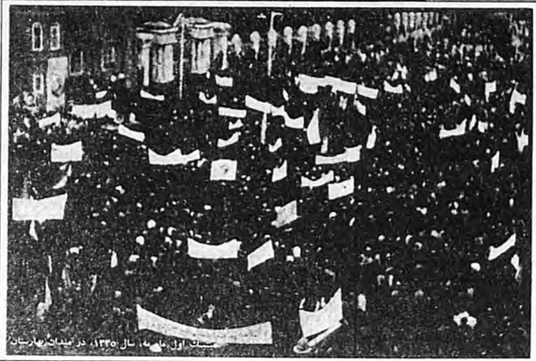
میتان اول ماه مه، سال ۱۳۳۰، در میدان پارس تهران