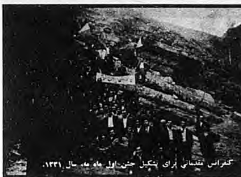
کتراس متسانی برای تشکیل جشن اول ماه مه، سال ۱۳۲۱.

پنجاه و هشت سال پیش یعنی در خردادماه ۱۳۰۰ کارگران و کلیه زحمت‌کشان ایران پس از یک سلسله مبارزات شدید موفق به تشکیل شورای مرکزی انجاده‌های حرفه‌ای گردیدند. مبارزه در راه ایجاد سندیکاهای کارگری در ایران ۵۰ سال پیش با تأسیس انجاده‌های کارگران چاپخانه موسوم به «کوکچه» در تهران آغاز شد و انجاده مذکور بعدها به‌انجاده کارگران چاپخانه‌ها تبدیل گردید. رشد جامعه و توسعه صنایع و ازدیاد تعداد پرولتاریای صنعتی، ایجاد آموزشگاه‌های ابتدائی و عالی و پدید آمدن روشنفکران ملی و مترقی باعث تشدید جنبش سندیکائی شد. در سال ۱۲۹۷ شسی در شهرهای تهران، تبریز، رشت و اسفهان و سرمایه‌داران (آن‌طور که در واقع چنین تعبیری شده است) بار دیگر نظام بهره‌کشی را باقی گذارید که منجر به پیدایش «طغوت» تازه‌ای شد. و با برعکس به‌انکای آسبه و درید آن نین‌علی‌الدین استمخمو فرالارض و نجله‌مه و نجله‌مه بالای آگاهی و قهرمانی را از خود بارها به‌منصه ظهور گذاشته. باور خادائین داریم و بر آنیم که در این مرحله بسیار بسیار بفریح و آشفته، مبارزه علیه ضد انقلاب و برای بی‌بازگشت کردن پیروزی انقلاب، آن‌ها بار دیگر خود را در اوج لازم‌نشان خواهد داد.